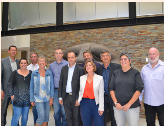
Laurent BERGER & les Délégués Syndicaux Centraux d'Orange

Engagement déterminé dans toutes les négociations et signature de nombreux accords qui n'apportent que du plus pour tous les salariés de l'entreprise dans tous les domaines : emploi, rémunération, conditions de travail, etc.